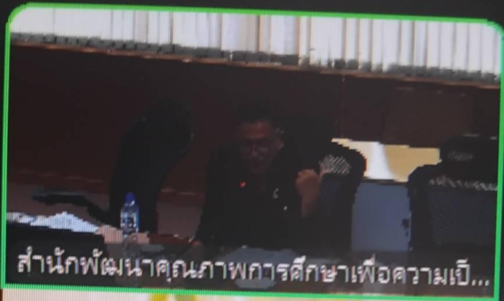
สำนักพัฒนาคุณภาพการศึกษาเพื่อความเป...